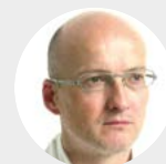
Johann Georg Meinhart Klinik Floridsdorf