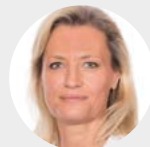
Gunda Gittler Apotheke Barmherzige Brüder Linz