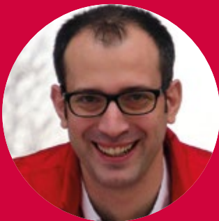
Martin Stein Hilti Austria GmbH

Fachleute informieren regelmäßig zu aktuellen Entwicklungen und Herausforderungen