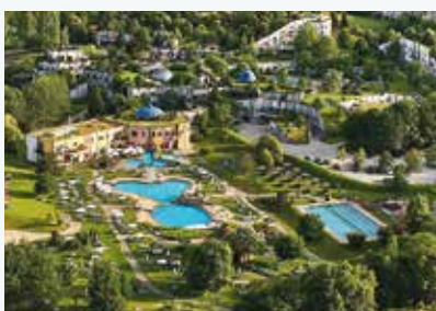
Rogner Bad Blumau © Hundertwasser Architekturprojekt

In Bad Blumau wurde die Vision vom Leben im Einklang mit der Natur, verwirklicht in einem Rückzugsort, in dem Landschaft und Baukunst achtsam miteinander verbunden sind. Eine märchenhafte Welt aus Farben und Formen. In der alles fließt. Ohne Ecken und Kanten, ohne gerade Linien. Ein bewohnbares Gesamtkunstwerk, gestaltet von Künstler Friedensreich Hundertwasser.